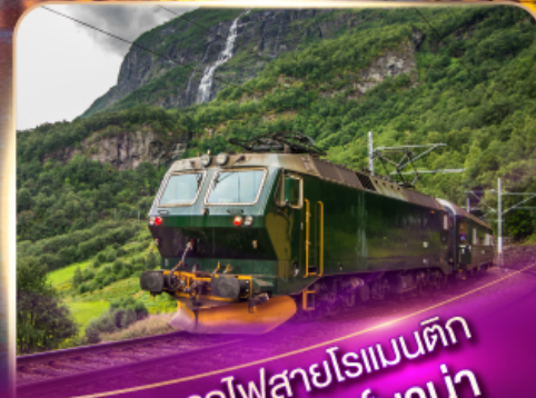
รถไฟสายโรเมนติก ฟลัมส์บาน่า