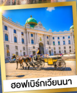
ออฟนิร์ทเวียนนา