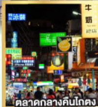
ตลาดกลางคืนโตง