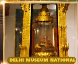
DELHI MUSEUM NATIONAL ถราเมนมีศการพระบรมสารีริกธาตุ

เมืองซินลาในม่านหมอก ดินแดนผู้ดีอังกฤษครึ่งปกครองเมือง / สัมผัสศรัทธาชาวซิกข์ วิหารทองคำกลางสระน้ำอมฤตสารี ชมความงามของ "อาณาจักรดาไลลามะ" ของเหล่ากษัตริย์ทิเบตที่วัดแห่งชัยชนะ "Namgyal Dratsang"