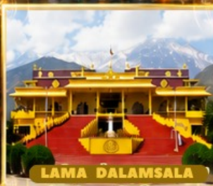
LAMA DALAMSALA ด้านบ้านองค์ดาไลลามะ