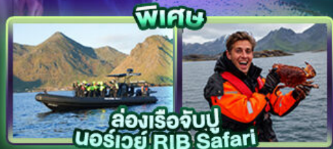
พิเศษ ล่องเรือจับปู นอร์เวย์ RIB Safari