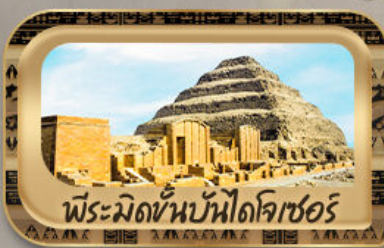
พีระมิดขั้นบันไดโจเซอร์