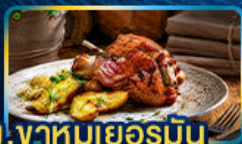
ปลาเทรตย่าง, ขาหมูเยอรมัน