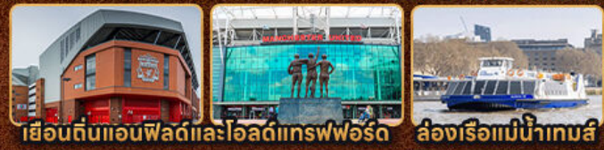
เยือนดินแอนฟิลด์และโอลด์แทรฟฟอร์ด ล่องเรือแม่น้ำเทมส์

London Stonehenge Liverpool Manchester Stratford Upon Avon