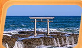
ศาลเจ้าโออาไรโอชิซาทิ

แพคเกจใกล้ชิด "ฟูจิซัง" ที่หมู่บ้านโอชิโนะ อักโท สวนโออิชิปาร์ค ที่เที่ยว Unseen นั่งกระเช้าชมวิวภูเขาสิคุยะ ศาลเจ้าโออาไรโอชิซาทิ เสาโทริอิริมทะเล อลังการโบสถ์เปลี่ยนสี น้ำตกเคงอน ศาลเจ้านิกโกโทโชกุ เสริมมงคล วัดพระใหญ่อุซึคุ โดบุทสึ ห้ามพลาดโคมแดงยักษ์ วัดอาซากุสะ อิมอร้อยตลาดปลาโทโยสุ ทัศนียภาพ 3D ย่านชิจูกุ ซุปปิ้งจุกุโจย่านดังชิบูย่า