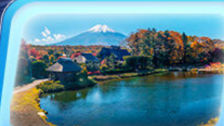
โอชิโนะอัทไก