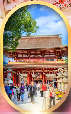
ศาลเจ้าคาโซฟู