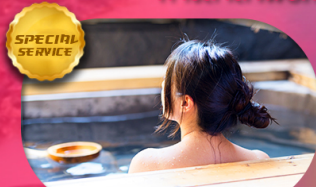
ที่พัคดี อาหารดี