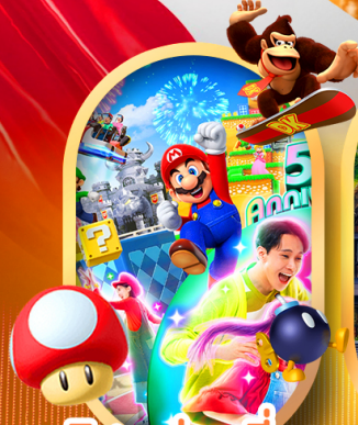
อิสระท่องเที่ยว หรือเลือกซื้อทัวร์เสริม USJ