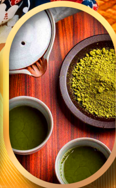
ซงซาแบบญี่ปุ่น