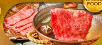
พิเศษเมนู บุฟเฟ่ต์ซาบู