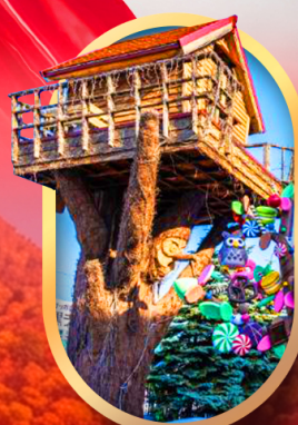
โรงงานช็อคโกแลต