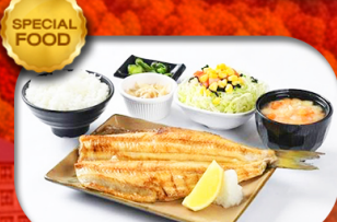
เมนูพิเศษ Set ปลาซอกเกะ