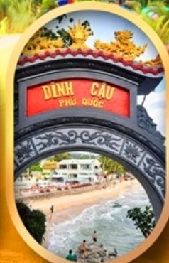
ศาลเจ้าติงเกา