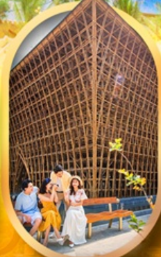
อาคารไม้ไฟ