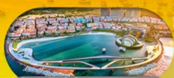
Kiss Bridge สะพานจูบ รวมค่าเข้าสะพานจูบแล้ว