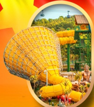
สวนน้ำ Hon Thom