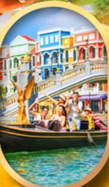
เวนิสแห่งเวียดนาม