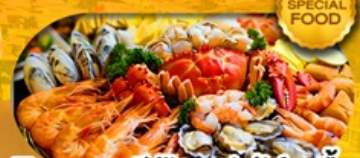
พิเศษเมนู ซิวัดบุฟเฟ่ต์ 1 มื้อ เดินทาง มีนาคม 2569