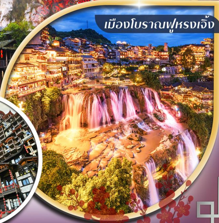
เมืองโบราณฟูหลงเจิ้ง

คอนเฟิร์มออกเดินทาง ตั้งแต่ 10 ท่าน ขึ้นไป