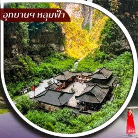
อุทยานฯ หลุมฟ้า