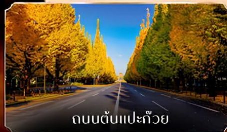
ถนนต้นแปะก๊วย