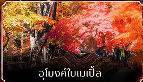
อุโมงค์ใบเมเปิ้ล