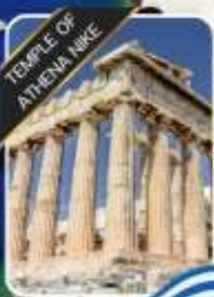
TEMPLE OF ATHENA NIKE