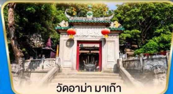
วัดอาม่า มาเก๊า