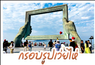
กรอบรูปเวย์ไห่

ถ่ายรูปย่านเมืองเก่าสไตลียอร์ม • โบสถ์เซนต์ไมเคิล และย่านปาต้ากวน พร้อมทัวร์พิพิธภัณฑ์โรงเบียร์ชิงเต่าระดับตำนาน ฟรี! ซิมเบียร์สดท่านละ 1 แก้ว เช็คอินมมมหาชนฟีลอินที่ถนนคนเดินเฟลิ่งสายที่ 8 • แวะถ่ายรูปสุดอาร์ตกับ ซากเรือบลูเวย์ • ตกค่ำตะลุยกินที่ตลาดสไตลียอร์ม ถนนอันเลื่องฟ้าง ที่ยิวอิสระตามใจชอบ จัดสรรเวลาให้ท่านด้วยวัน FREE DAY 1 วันเต็มในชิงเต่า