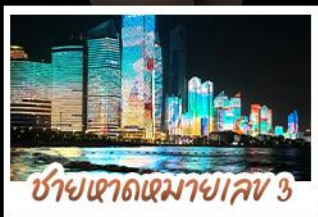
ซ่าเขตแดนมาเจลเลข 3