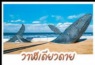
วาฬยัดขวิดตาย