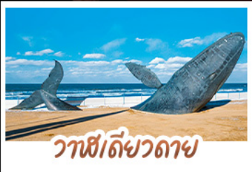
วาฬโต้วลาย