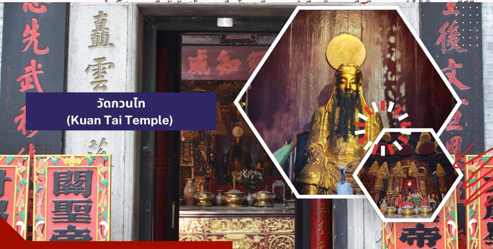
วัดกวนไท (Kuan Tai Temple)

นำท่านเดินทางสู่ เซนาโดสแควร์ เป็นจัตุรัสสำคัญในใจกลางเมืองมาเก๊า มีลักษณะเป็นพื้นที่เปิดโล่งที่ล้อมรอบด้วย