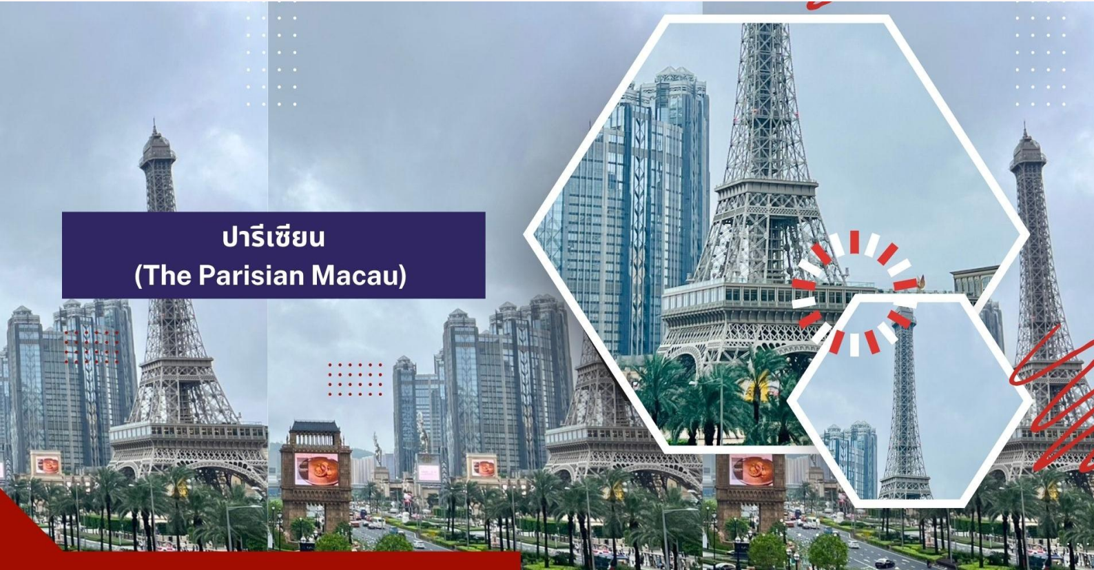
ปารีสเซียน (The Parisian Macau)

นำท่านเดินทางสู่ วัดอามา (A-Ma Temple) ให้ทุกท่านได้กราบไหว้เจ้าแม่ทับทิม ซึ่งเป็นวัดที่มีชื่อเสียงมากๆ สำหรับวัดแห่งนี้ตั้งอยู่ ใกล้กับทะเล ภายในวัดดูแล้วก็แปลกตาดีเพราะว่ามีการก่อสร้างกันแบบลดหลั่นกันไปตามพื้นที่ที่อำนวยการ เนื่องจากสถานที่แห่งนี้ตั้งอยู่ริมเชิงเขา เมื่อเดินพันซุ่มประตูก็จะพบกับศาลของเจ้าแม่ทับทิมตั้งอยู่นอกจากนั้นก็ยังมีย หอเมตตารธรรม ศาลเจ้าแม่กวนอิม ศาลพุทธชินเจ้าชานหลินและยังมีศาลเจ้าขนาดเล็กๆ อีกหลายศาลที่ได้มีการสร้างเพื่อถวายให้แก่เจ้าแม่ทับทิม