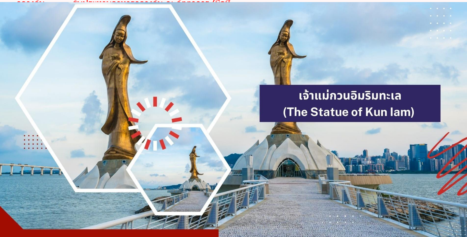
เจ้าแม่กวนอิมริมทะเล (The Statue of Kun Iam)

นำท่านเดินทางสู่ วัดกวนไท (Kuan Tai Temple) หรือรู้จักกันในชื่อ วัดซ่าไถกวยคุน (Sam Kai Vui Kun Temple) เป็นวัดที่มีความสำคัญทางประวัติศาสตร์และวัฒนธรรมในมาเก๊า ได้รับการขึ้นทะเบียนเป็นมรดกโลกของ UNESCO ร่วมกับศูนย์กลางประวัติศาสตร์มาเก๊าในปี ค.ศ. 2005 เนื่องจากคุณค่าทางประวัติศาสตร์ สถาปัตยกรรม และวัฒนธรรมที่โดดเด่น ตั้งอยู่ใจกลางจัตุรัสเซนาโต้และรายล้อมไปด้วยอาคารสไตล์ยุโรป วัดนี้สร้างขึ้นเมื่อปี ค.ศ. 1750 และเป็นที่ประดิษฐานของเทพเจ้ากวนอู ซึ่งเป็นเทพเจ้าแห่งความมั่งคั่งและปกป้องคุ้มครอง วัดแห่งนี้มีเป็นที่นิยมของผู้ทำธุรกิจ ตำรวจ และนักการเมือง เพราะเชื่อว่าสามารถปกป้องสิ่งชั่วร้ายต่างๆ และช่วยเสริมอำนาจบารมีในการปกครองและคุ้มครองบริวาร