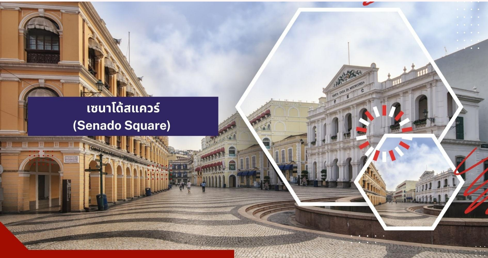
เซนาโดสแควร์ (Senado Square)

นำท่านเดินทางสู่ เซนาโดสแควร์ เป็นจัตุรัสสำคัญในใจกลางเมืองมาเก๊า มีลักษณะเป็นพื้นที่เปิดโล่งที่ล้อมรอบด้วย