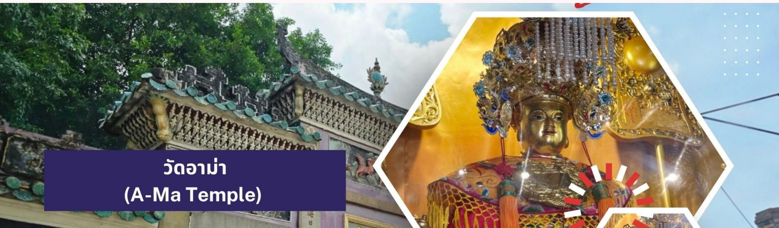
วัดอาม่า (A-Ma Temple)

นำท่านชม เจ้าแม่กวนอิมริมทะเล (The Statue of Kun Iam) เจ้าแม่กวนอิมปรางค์ทองสร้างด้วยทองสัมฤทธิ์ทั้งองค์ มีความสูง 18 เมตร หนักกว่า 1.8 ตัน ประดิษฐานอยู่บนฐานดอกบัวดูงดงามอ่อนช้อย สะท้อนกับแดดเป็นประกายเรืองรองเหลืองอร่ามงดงาม จับตา เจ้าแม่กวนอิมองค์นี้เป็นเจ้าแม่กวนอิมลูกครึ่ง คือ ปั้นเป็นองค์เจ้าแม่กวนอิมแต่ตัวกลับมีพระพักตร์เป็นหน้าพระแม่มาลีที่เป็นเช่นนี้ก็เพราะว่าเป็นเจ้าแม่กวนอิมโปตุเกสตั้งใจสร้างขึ้นเพื่อเป็นอนุสรณ์ให้กับมาเก๊าในโอกาสที่ส่งมอบมาเก๊าคืนให้กับจีน