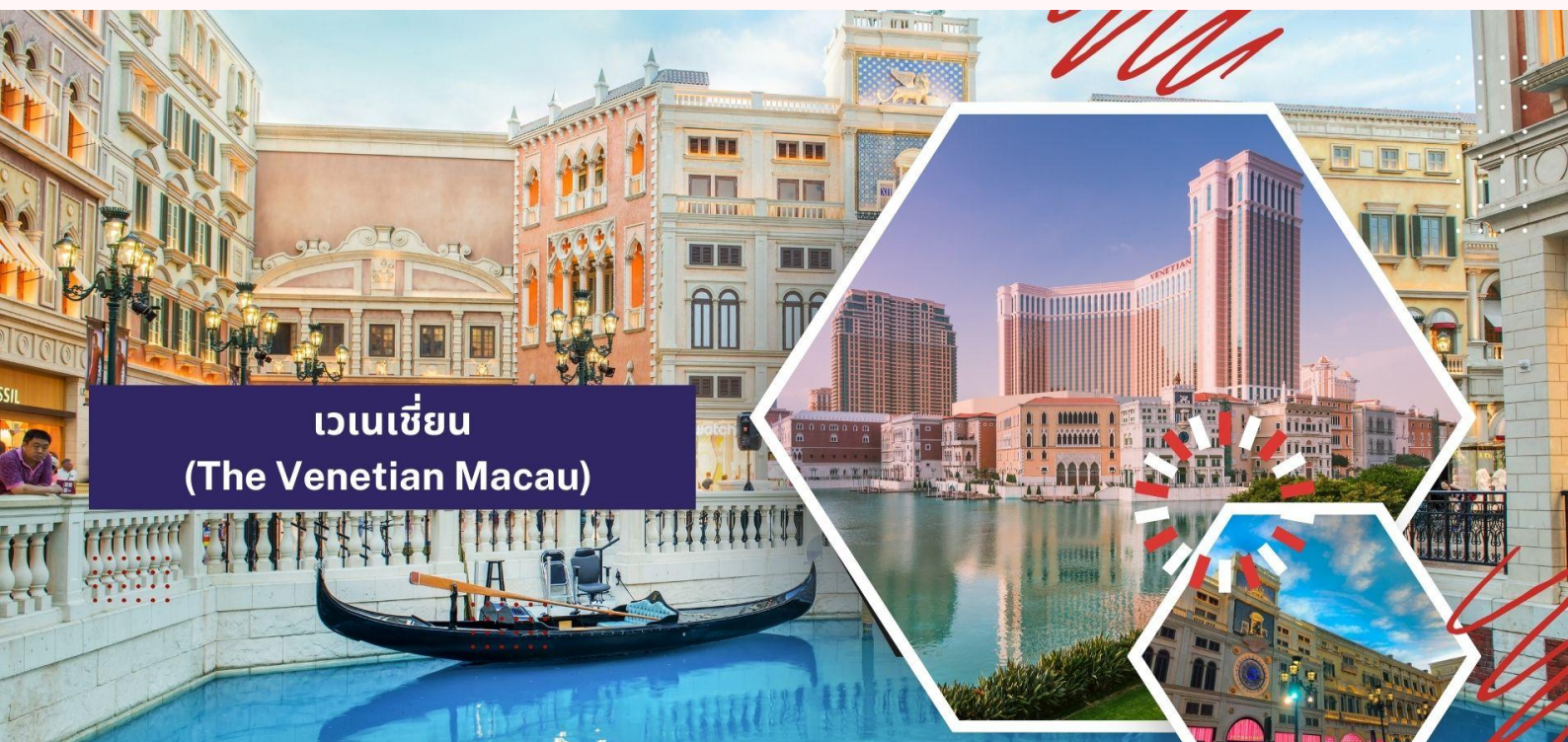
เวเนเซียน (The Venetian Macau)

จากนั้นนำท่านถ่ายภาพกับ ปารีสเซียน (The Parisian Macau) ซึ่งเป็นรีสอร์ทหรูหรารอบวงจรถูกตั้งอยู่ในมาเก๊า ได้รับการออกแบบมาเพื่อจำลองหอไอเฟล แห่งปารีส อิสระให้ท่านได้เพลิดเพลินกับการถ่ายรูป