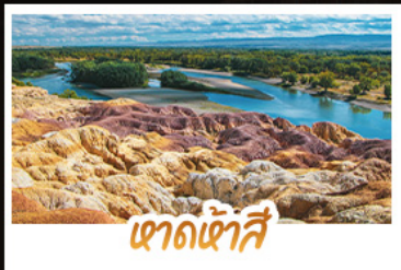
ชาดเซ้าชี