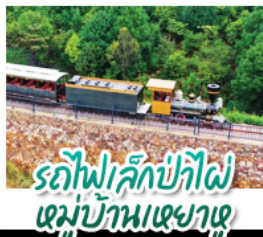
รถไฟเล็กป่าไผ่ หมู่บ้านเฉาเซว