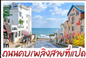
ถนนคอบาเพลิงสายที่แปด