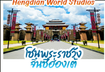
โซนพระราชวัง จินซีฮ่องเต้