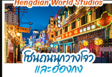
โซนถนนกวางโจว และฮ่องกง