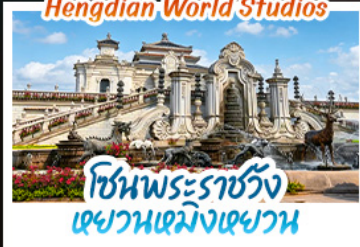
โซนพระราชวัง เฉียวเหมิงเฉียวเหมิง