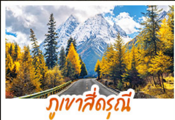
ภูเขาสีดรณ์

จุดชมวิวน้ำแข็ง 360 องศา "อุทยานต้ากู่ปิงชวน" • สัมผัสสมมติแสนหฤหรรษ์ใบไม้เปลี่ยนสี แห่งแดนสวรรค์เสฉวนเหนือ • ชมทะเลสาบหลากสีแห่งที่จิวจ้ายโกว • ซ้อมปิ้งจิวจ้ายโกวที่ทุกหิลี่ ถนนคนเดินซุมซิว, ถนนโบราณชอยกวางชอยเคบ • นั่งรถไฟความเร็วสูง 174