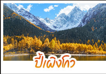
ป่าผิงโกว