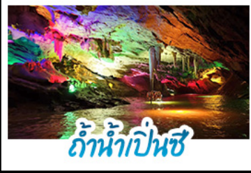
ถ้ำน้ำเปิ่นซี

แกรนด์เสฉีซาเน็ง 5 นคร...ชมเวนิสต้าหลุยส์สุดปัง เยือนชายแดนตามตงสุดอลัง ล่องแม่น้ำเป็นซีสุดอลัง ย้อนรอยวังเส้นหยางกู่กิง