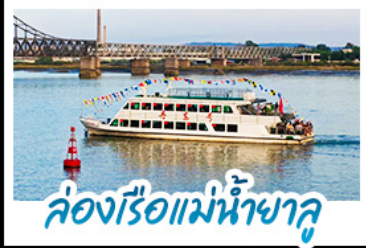
ล่องเรือแม่น้ำชาลู่