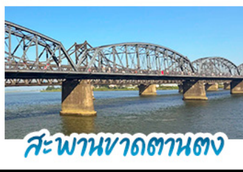
สะพานขาดสถานตง