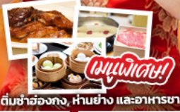
ต้นชาฮ่องกง, ฟันย้ง และอาหารชาบู