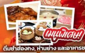
ต้มยำฮ่องกง, ห่านย่าง และอาหารชาบู