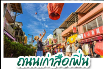
ถนนเก่าลี่อเฟิน