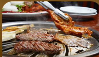
เมนูย่างสไตล์เกาหลี