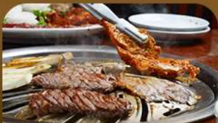
เมนูย่างสไตล์เกาหลี