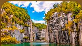
เขาน้ำตกปะเมืองโพซอน

คามาโนะไม่เปลี่ยนสีสุดโรแมนติก ชมวิวทะเลสาบหลากสีจากสะพานแขวนรูปตัว Y แห่งเมืองโพซอน สัมผัสความงดงามของโพซอนอาร์ทวอลล์ • เดินเล่นท่ามกลางต้นแปะทิวและเมเปิ้ลในพระราชวังเคียงบกกรุงโซล ชมหมู่บ้านอันออกกลางบรรยากาศย้อนยุค และปิดท้ายด้วยทุ่งหญ้าสีทอง ณ สวนฮานิล แลนด์มาร์กยอดนิยมของกรุงโซล ในช่วงฤดูใบไม้เปลี่ยนสีที่สวยงามที่สุด