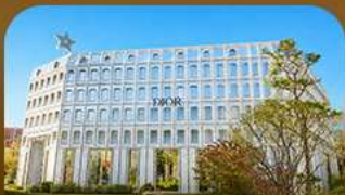
ย่านซองซู