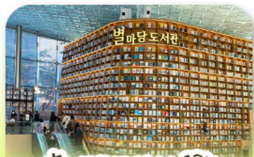
ห้องสมุดสตาร์ฟิลา

เก็บทุกไฮไลท์ ในกรุงโซล ตั้งแต่ความงดงามของ พระราชวังเคียงบ็อก ชมวิวสุดอลังการที่ ดึงลือตเต็ โซลสกาย (รวมค่าลิฟต์ขึ้นตึก) สนุกสุดมันส์ที่ สวนสนุกลือตเต็ เวิร์ล (รวมค่าบัตรเครื่องเล่น) พลิคเพลนไปกับโลกใต้ทะเล ลือตเต็ อควาเรียม (รวมค่าบัตรเข้าชม) เช็กอินแลนด์มาร์กสุดฮิตอย่างห้องสมุดสตาร์ฟิลา โคเอกมอลล์ เดินเล่นย่านฮิป บรู๊กลินเกาหลี่ ซองชูดง และช้อปปิ้งซัมเมอร์เซล สุดฟิน ย่านเมียงดงและฮงแด