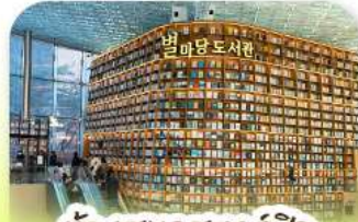
ห้องสมุดสตาร์ฟล

เก็บทุกไฮไลท์ ในกรุงโซล ตั้งแต่ความงดงามของ พระราชวังเคียงบ็อก ชมวิวสุดอลังการที่ ดึงลือตเต็ โซลสกาย (รวมค่าลิฟต์ขึ้นตึก) สนุกสุดมันส์ที่ สวนสนุกล็อตเต้ เวิร์ล (รวมค่าบัตรเครื่องเล่น) เพลิดเพลินไปกับโลกใต้ทะเล ล้อตเต็ อควาเรียม (รวมค่าบัตรเข้าชม) เช็กอินแลนด์มาร์กสุดฮิตอย่างห้องสมุดสตาร์ฟล โคอิทอมอลล์ เดินเล่นย่านฮอป บรูกลินเกาหลี ซองชูดง และช้อปปิ้งซัมเมอร์เซล สุดฟิน ย่านเมียงดงและฮงแด