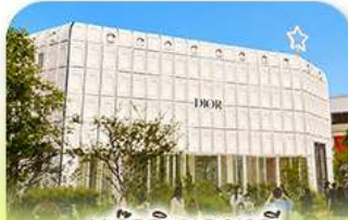
บรูกลินเกาหลี