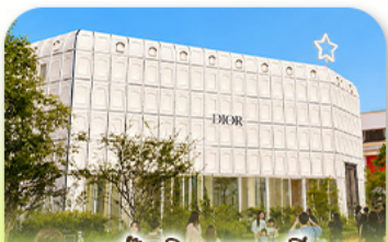
บรู๊กลินเกาหลี่