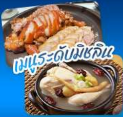
เมนูระดับมิชลิน

เที่ยวชม 3 เมืองฮิต โซล - แทกู - ปูซาน สัมผัสเสน่ห์เกาหลีหลากหลายสไตล์ • ชมพระราชมังคลาภิเษก ตึก Lotte World Tower พร้อมจุดชมวิว Seoul Sky ในกรุงโซล • ชิคอินถนน Art Street ตามรอย BTS ตลาดชอมนุน • แลนด์มาร์ก 83 Tower ที่แทกู • ปักถ่ายที่ปูซานกับวัดแดงยงกุงซา หมู่บ้านวัฒนธรรมคิมซอน โซลที่นั่งรถไฟสายกายภาพชุลลิมวีกะเลสูดประทับใจ • เดินทางสะดวกด้วยรถไฟความเร็วสูง KTX อิมมอร์ทัลกับเมนูพิเศษ จากเกาหลีและไต้หวันพรีเมียมระดับมิชลิน เก็บครบทุกความประทับใจในทริปเดียว