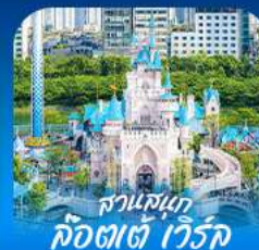
สวนสนุก ล็อดเจสท์ วัลวิค