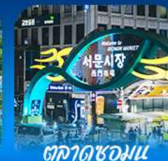
ตลาดชอมนุน