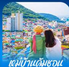
หมู่บ้านคัมเชอน