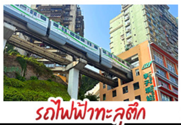
รถไฟฟ้าทะเลซุติ๊ก