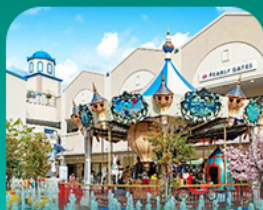
ลิตเติ้ลพีร์มียูมอ้ากีสิต