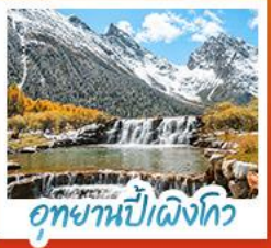
อุทยานปีผิงโกว