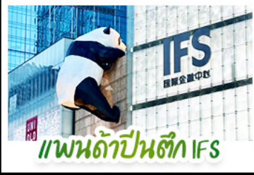
แพนด้าปีนตึก IFS

ชมภูเขาหิมะ-สีดรุณี อลังการสมญา "แอลป์แห่งเสฉวน" สัมผัสความงามของ อุทยานปี้เฉิงโกว หุบเขาแห่งน้ำตกธารน้ำแข็ง ช้อปปิ้งจุใจ ถนนไท่กู่หลี่ ถนนคนเดินชุมชิวู๋ ถนนโบราณชอยกวางชอยแคบ