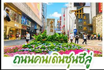
ถนนคนเดินชิวู๋