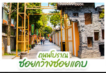
ถนนโบราณ ชอยกวางชอยแคบ