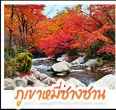
ภูเขาหมื่นชางซาน