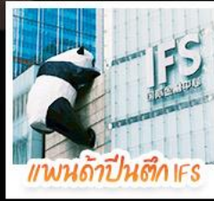
แพนด้าปาร์ค IFS