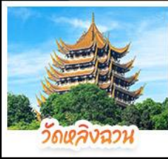
วัดหลิงฉวน