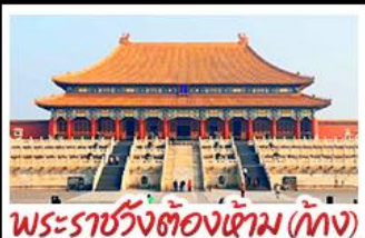
พระราชวังต้องห้าม (ปักกิ่ง)