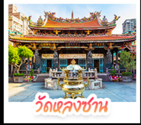
วัดเลกงชาน