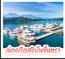
ล่องเรือสุริยันจันทร์

10 - 14 ก.ย. 69 | 08 - 12 ต.ค. 69 24 - 28 ก.ย. 69 | 22 - 26 ต.ค. 69