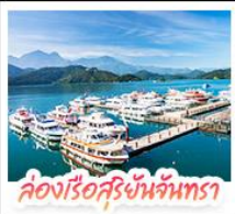
ล่องเรือสุริยจันทร์

ล่องเรือชมทะเลสาบสุริยจันทร์ (SUN MOON LAKE) ชมทะเลสาบ หวง-วัดสวนทอง • อิสระเดินเล่น หมู่บ้านอู่ต๋าเซ่า • นั่งรถไฟเล็กโบราณ (1 สกามี) สัมผัสบรรยากาศเส้นทางรถไฟสายธรรมชาติ • ตะลุย ไทจงไม้ไผ่บาร์เทค แหล่งรวมแฟชั่นและสตรีทฟู้ด • ช้อปบิงช่าน ซีเหมินติง (XIMENDING) ถ่ายรูปแลนด์มาร์ค ดึกไทเป 101 • ช้อปบิงกิงทงที่ MITSUI OUTLET PARK ชมความสวยงามของ อนุสรณ์สถานเจียงไคเช็ค • ขอพรความรักที่ วัดหลงชาน ชมโศกหิมะที่สวยงามที่ เย่หลิว • ชมบรรยากาศเมืองเก่าที่ จิวเฟิน