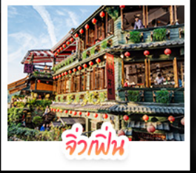
จิวเฟิ่น