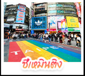
ซีเหมินตง