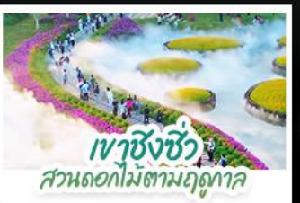
เวาซิงซิว สวนดอกไม้ตามฤดูกาล