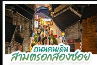
ถนนคนเดิน สามตรอกสองซอย

สัมผัสประสบการณ์ล่องเรือชมน้ำตกเต๋อเทียนแบบใกล้ชิด ชมแสงสียามค่ำคืน ณ เมืองโบราณไท่ผิง • ทำความหนาวเย็น อากาศดีตลอด ณ ถ้ำน้ำแข็งหลงกง • เช็กอินติดเทรนด์กับท่าเรือ กังจื่อตงสไตล์ยุโรป • ชมหมู่บ้านสไตล์ยุโรป ทะเลสาบหมิงเยว่ ช้อปปิ้งเพลินถนนคนเดิน สามตรอกสองซอย