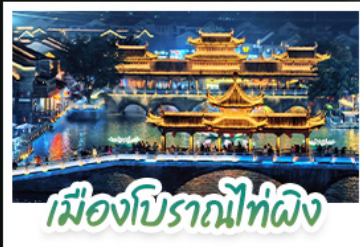
เมืองโบราณโก่ผิง