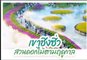
เขาสั่งซิว สวนดอกไม้ตามฤดูกาล