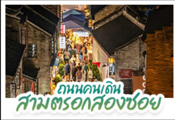
ถนนคนเดิน สามตรอกสองซอย

สัมผัสประสบการณ์ล่องเรือชมน้ำตกเต๋อเทียนแบบใกล้ชิด ชมแสงสียามค่ำคืน ณ เมืองโบราณโก่ผิง • ทำความหนาวเย็น อากาศดีลม ณ ถ้ำน้ำแข็งหลงกง • เช็กอินติดเทรนด์กับท่าเรือ กังจื่อตักสไตล์ยุโรป • ชมหมู่บ้านสไตล์ยุโรป ทะเลสาบหมิงยว ซ้อปิงเฟลีนถนนคนเดิน สามตรอกสองซอย