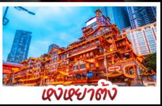
แดงเฉยาตัง

2UCKG-CZ005 | 中国南方航空 CHINA SOUTHERN | 5 วัน 3 คืน | ไม่ลงร้านช้อปปิ้ง