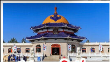
สุสานเจกิสข่าน