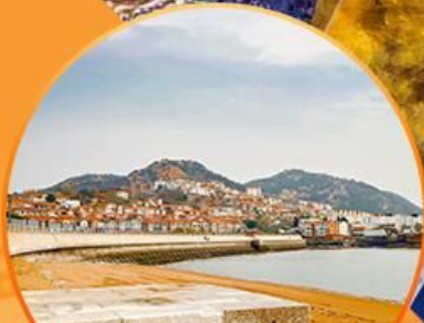
ซาจื่อโป่ว