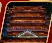
Dafo Buddhist temple