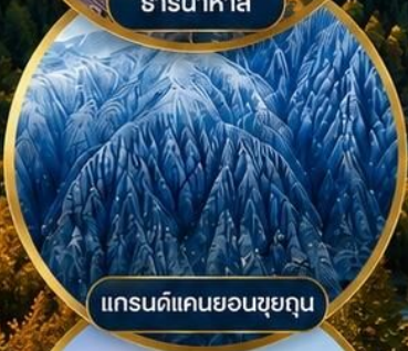
แกรนด์แคนยอนซูยถุ่น