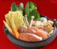
สุกัปลาแซลมอน