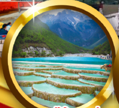
ทะเลสาบไ้สวยเห่อ