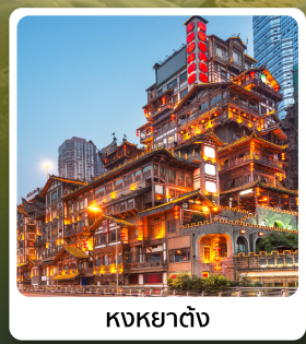
หงหยาดตั้ง

ไฮโลก์! อุทยานแห่งชาติหลุมบ่อฟ้า มรดกโลกระดับ 5A รถไฟฟ้าทะลุตึก ตึกตะเกียบ อลังการแสงสีหงหยาดตั้ง