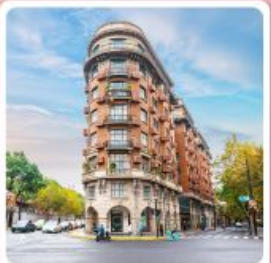
ถนนอู๋คัง