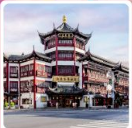
ตลาดร้อยปีเงินหวังเหมียว