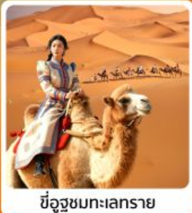
ชีอูชวมทะเลทราย

• โฮเทล เป็นทรายเป็นชาวาน แหล่งท่องเที่ยวระดับ 5A ของจีน แกรนด์แคนยอนแม่น้ำเหลือง ชีอูทามกลางทะเลทราย