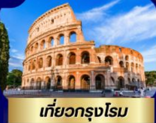
เที่ยวกรุงโรม